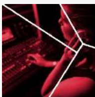
Imagen y sonido Irudia eta soinua

(I) La lengua extranjera del ciclo bilingüe es Inglés