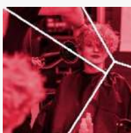
Imagen personal Irudi pertsonala

(I) La lengua extranjera del ciclo bilingüe es Inglés